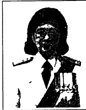
นางสาวนารี ตันทเสถียร อธิบดีอัยการ สำนักงานที่ปรึกษาอัยการ

หากท่านผู้ใดมีข้อมูล ข้อเท็จจริง และข้อคิดเห็นเกี่ยวกับบุคคลผู้ได้รับการเสนอชื่อ ให้ดำรงตำแหน่งอัยการสูงสุด