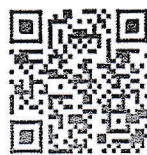
แบบตอบรับ