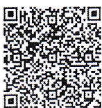
กำหนดการจัดงาน

สำนักงานคณะกรรมการส่งเสริมวิทยาศาสตร์ วิจัยและนวัตกรรม