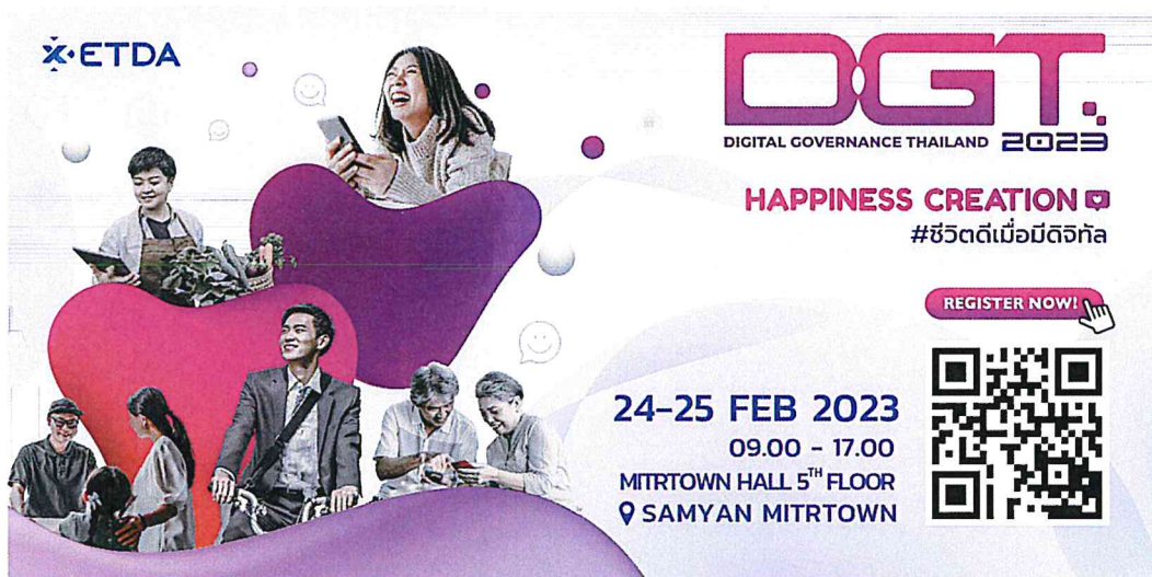
ตัวอย่าง Banner