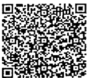
แบบฟอร์มขอโอน

จึงเรียนมาเพื่อโปรดประชาสัมพันธ์ให้ข้าราชการและหน่วยงานในสังกัดของท่านทราบด้วย จะขอบคุณยิ่ง